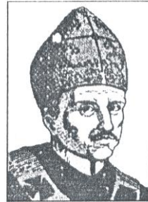
Santo Toribio de Mogrovejo Organizador de la Iglesia peruana