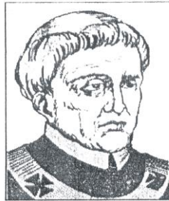
Fray Jerónimo de Loayza Primer Arzobispo de Lima

Franciscanos: Selva central (misión de Ocopa), desarrollado en el siglo XVIII. Descubrieron y colonizaron Chanchamayo, el Gran Pajonal y las áreas vinculadas a los ríos Perené, Paucartambo y Ucayali.